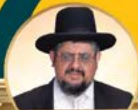
מודע ודבנו ראש המוסדות וראש הישיבה הגדולה