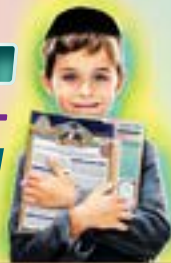
עורך: הרב ג'ר' שמואל עידאן שליט"א