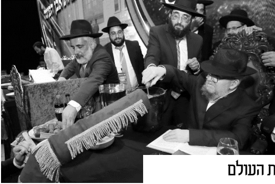
ומאירים את העולם