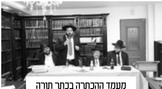
מעמד ההכתרה בכתר תורה