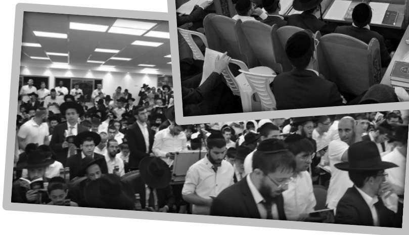
אי"ה בחודש הקרוב תופיע כתבה נרחבת אודות בניין הבית