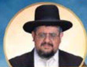
מרטו דובנו ראש המוסדות וראש חרשיה הגולה האון רבי הנגאל בון שליט"א