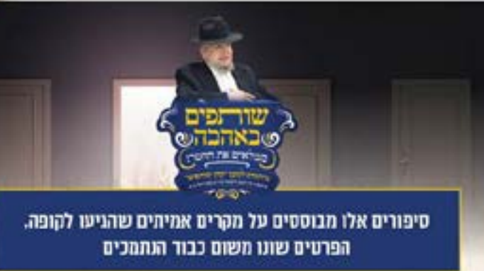
סיפורים אלו מבוססים על מקרים אמיתיים שהגיעו לקופה הפרטים שוננו משום כבוד הנתמנים

נלחם ביוונים והם החריבו את העיר שלו... אחרי כמה שנים שהלך בשבי, הגיע שוב למקום הזה, ואמר להם: שקרנים! אמרתם לי שאחריב עיר גדולה! אמרו לו: הכוונה שלנו העיר שלך... לא אמרנו איזו עיר גדולה, וכי אמרנו שאתה תחריב את העיר של היוונים? ...! אמרנו רק: "אם תלך להילחם תחריב עיר גדולה", הלשון משתמעת לתרי אנפיו. ואילו אורים ותומים לא עושים ככה, אלא עונים ישר: "ויאמר דוד היסגירו בעלי קעילה אותי ואת אנשי ביד שאול ויאמר ה' יסגירו" (ש"א כ"ג י"ב), "הירד שאול - יָרַד" (שם פסוק י"א) מלה אחת, בקיצור נמרץ 16 .