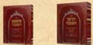
ספר חיים חלמה וימים נודים