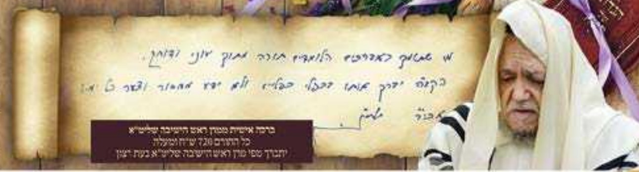
ברכה אישית מן חז"ל, אצל חסידי פלשטינה כל חודש 26 ש"ז וזמנית יחבר ש"י מן ראשי השבוע פלשטינה בעת יציאת

תורה, ולכן פעם הרב עובדיה כתב (חז"ל ע"פ פסח ע"ר) שאסור לו להשתתף בסיום מסכת, אבל אחר כך בחזון עובדיה אבולות (ח"ג ע"פ קט"ז) הרב כתב שמותר לאבל להשתתף, אבל בשעת לימוד הסיום יסיח דעתו מדברי התורה. אבל אם הוא מסיח דעתו מה עשינו? הרי כל הסיום הזה הוא כדי שישמע משהו, ולכן ישמע לסיום אבל לא יעיין בעומק, ויאמר יש לי שאלה של הרב שאגת אריה והרב אבני נזר 24 , אלא ישמע ויקשיב [בשמיעה בעלמא]. ואם בא אליו חידוש יפה מאד, ירשום אותו בראשי תיבות. ואחרי השבעה יכתוב מה שירצה.