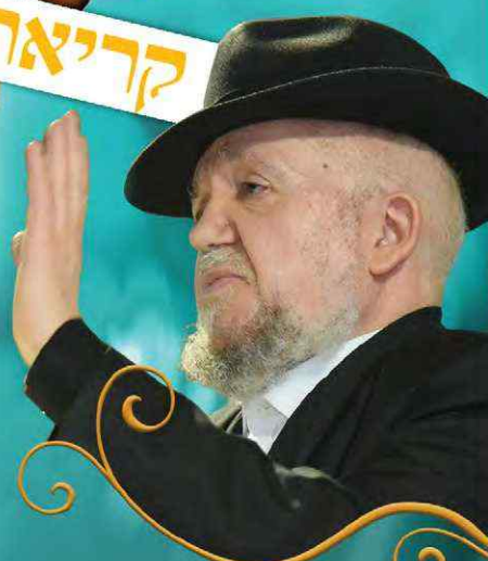
עטרת ראשו מרן פאר הדור רבנו מאיר מאזוז שליט"א

רכב שברולט 2019 או תמורתו במזומן תכשיטי זהב ויהלומים ועוד פרסים יקרי ערך