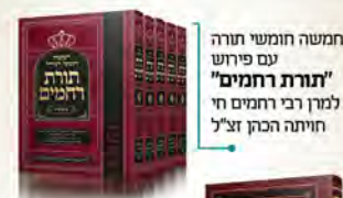
חמשה חומשי תורה עם פירושו "תורת רחמים" לנדר רבי רחמים חי חויתה הכותב זצ"ל

30. היה שם יהודי אחד שכל הזמן היה תורם בעין יפה שם, אבל התרוש מסכן, אתם יודעים למה? כי הוא השקיע כספים במניות בכל מיני דברים. וצריכים לדעת שהמניות הן מסוכנות ולא להשקיע בהם. פעם שאלו חסיד אחד מחסידי חב"ד: במה התעשרת? אמר להם: שמעתי בקול הרבי שאומר לא להשקיע במניות, ולא השקעתי. כל אלה שמשקיעים אח"כ אומרים "אלו העבירו בתוכו בחורבה, ולא שקע צרינו בתוכו דיינו", למה אנחנו נשקע? שישקעו הצרים שלנו. אבל הבן אדם הזה שקע, ושמונה עשר מליון דולר הלכו וירדו במניות רח"ל. צריך לדעת מה שה' נותן מבורך, ורק אם יש לך דבר כזה שתון שבוע-שבועיים תרוח מזה, אין הכי נמי, אבל אם אין לך דבר כזה לא חייבים להתעשר, אל תיגע להעשיר" (משלי כ"ג ד). המנוח היה נעזר ביהודי הזה, אבל עכשיו שהוא התרוש, צריכים לעזור ולחזק את המניין והכולל שלו.