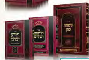
שמחת כהן (מהדורה חדשה) חיים ושלוה ודוד יצחק על התורה למור'ו יצחק טייב עליה