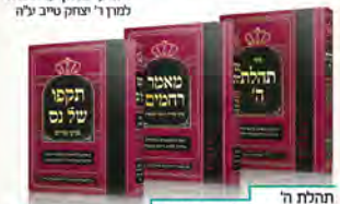
התלת ה' מנאר רחמים תקפו של נס ניתן להשיג גם בצפנית