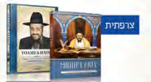
צרפתי מנחת ערב טועמיה חיים