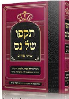
הלכות פורים ופירוש על מגילת אסתר מהגאון ר' מאיר הכהן שליט"א