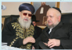
מרן זצ"ל בביקורו האחרון בישיבת כסא רחמים

המבקר בביתו של מרן ראש הישיבה שליט"א יראה כי במקום לימוד מעל ראשו ושולחנו מופיעים שתי תמונות במשך שנים רבות, הראשונה תמונת הרמב"ם והשנייה תמונת מרן מלכא זצ"ל, כמו כן התלמידים יודעים כי אין שיעור או שיחה מראש הישיבה שבה ידלג הרב על הנהגה מוסר מידה או שמועה מהרמב"ם וממרן מלכא זצ"ל. עליות על כולנה הוא שיעורו היומי בעיון הגמרא של מרן ראש הישיבה שליט"א, שיעור נחשק אשר התלמידים בו נבחרים בקפידה 16 בחורים בלבד (הואיל שדעת ראש הישיבה שרק במיעוט תלמידים יוכלו לקנות דרכי העיון כראוי) מתוך כ-60 בחורים שיש בכל שיעור, על ידי כמה מבחנים בעיון עמוק, התלמידים שזכו להבחר ולהכנס לשיעור זה מכינים את השיעור במשך כמה שעות (ולפעמים במשך היום כולו), ואחר כך נכנסים לשיעור שאורך שעתיים. בימי חמישי משתנה חומר הלימוד, במקום הגמרא התלמידים מכינים תשובה בשו"ת "יביע אומר" ואחר כך מוסר ראש הישיבה את השיעור על תשובת מרן מלכא, התלמידים מקשים ומתמצים כדרך הלימוד בגמרא עד שמונחים על ידי מרן ראש הישיבה שליט"א להבין דרכו הסלולה של מרן מלכא ודרכו בהלכה.